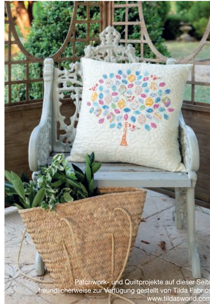
Patchwork- und Quiltprojekte auf dieser Seite freundlicherweise zur Verfügung gestellt von Tilda Fabrics www.tildasworld.com