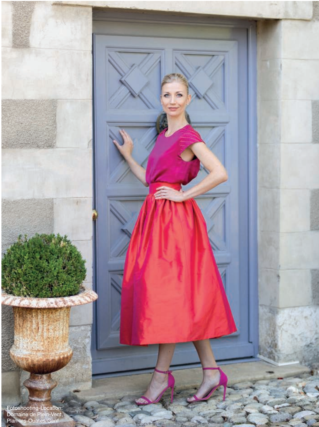
Fotoshooting-Location: Domaine de Plein-Vent, Plan-les-Ouates/Genf